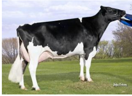
Modena Großmutter Morningview Shottle Lucy