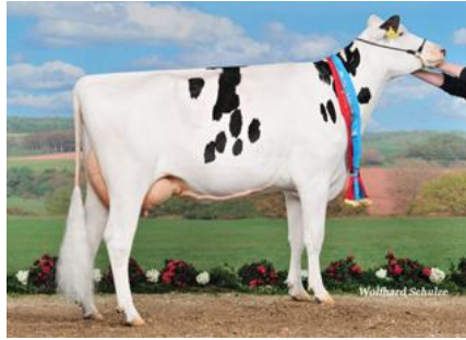
Lector-Tochter GKC California