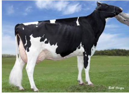
Davos-Großmutter Regancrest S Chassity