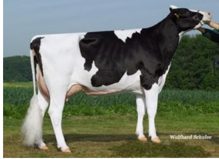
Boom-Mutter FWS Whitney